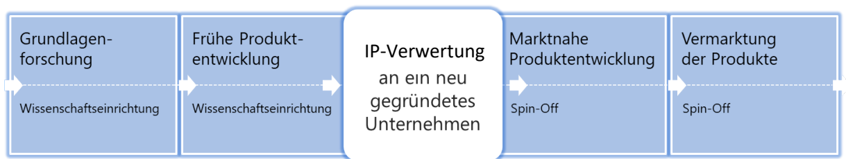
Abbildung 1: IP-Verwertung über eine Gründung

Innovative Gründungen aus Hochschulen und Forschungseinrichtungen (nachfolgend Wissenschaftseinrichtungen genannt) sind eines der wichtigsten Instrumente, um Forschungsergebnisse in eine kommerzielle Anwendung zu überführen und damit einen Beitrag zum wirtschaftlichen und gesellschaftlichen Fortschritt zu leisten. Daneben leistet die Wissenschaftseinrichtung über die Gründung von neuen Unternehmen einen wichtigen Beitrag zur Wertschöpfung durch die Schaffung neuer, hochwertiger Arbeitsplätze in einer Region und darüber hinaus.